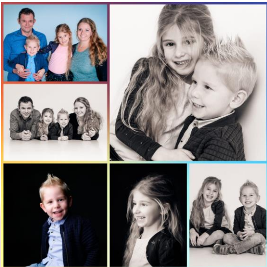
Heerlijk genieten van en met ons gezin!